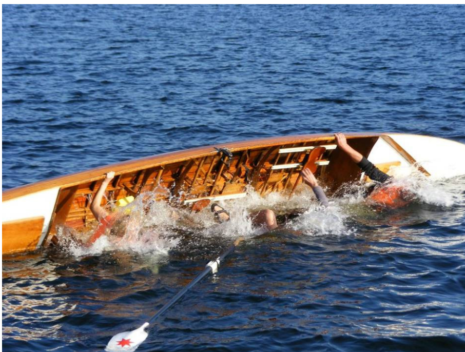
Det er altid godt at have fokus på sikkerhed. Her holdes der kæntringsøvelse i Silkeborg Roklub.