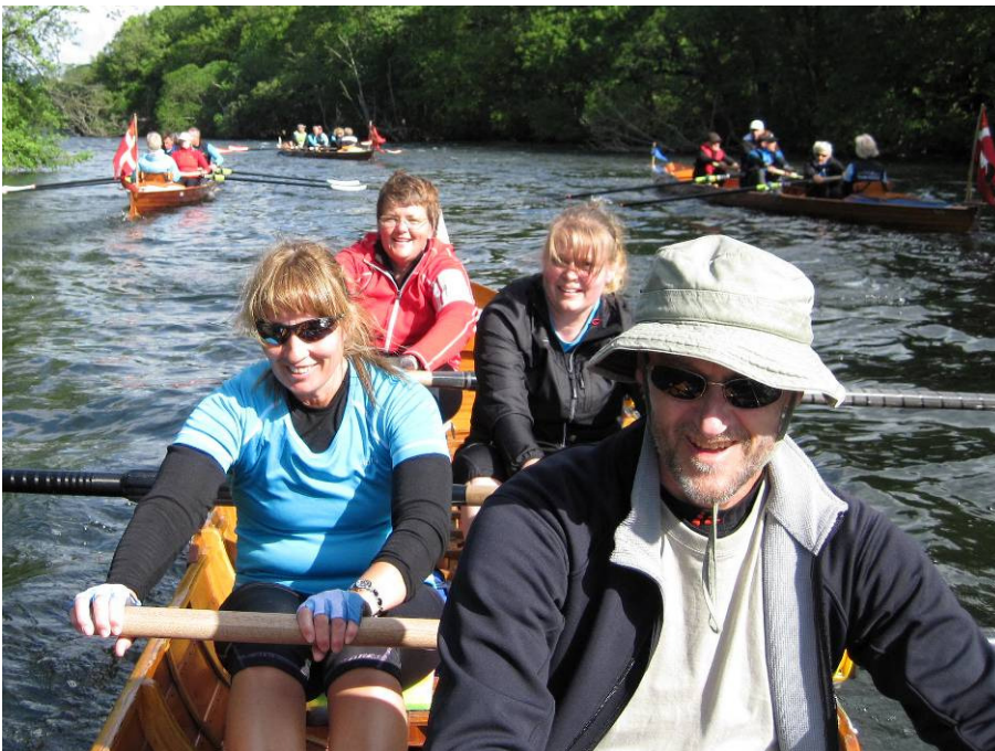
Roere fra Varde Roklub og Randers Roklub på langtur på Gudenåen fra Ry til Randers.

I Supermotionsligaen er det vinderne af Motionsturneringen 2010 Roklubben Furesø, der har taget det sidste lille - men svære - skridt op til førstepladsen. Dermed bytter Roklubben Furesø plads med Lyngby, der denne gang ligger nummer to. Der er et pænt stykke mellem Lyngby og Furesø og i løbet af blot en måned er det lykkedes Furesø, at rykke med gennemsnitlig 19,316 kilometer i forhold til Lyngby, så det er en imponerende mellemspurt, der er præsteret af Furesø.