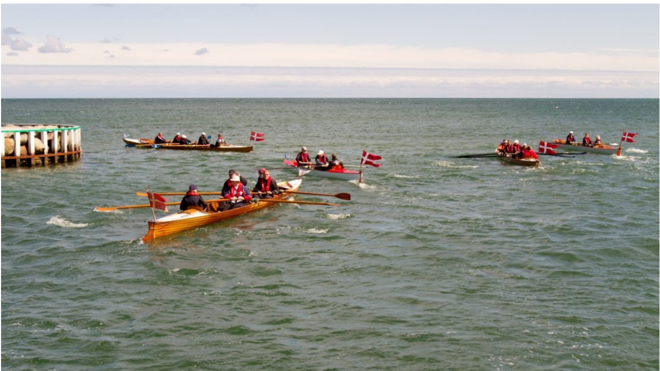
Søndag den 3. juni 2012: En armada fra Nordjysk Ronetværk stævner ud i Kattegat fra Rønnehavnen i Frederikshavn.

Nakskov Roklub rykker to pladser tilbage og er nu nummer fem. Hobro Ro- og Kajakklub er fortsat nummer seks. Gerhardt beretter: I Hobro har langtursroning været i fokus i juni. Først på måneden var seks roere til løvspringsroning i Frederikshavn og fik prøvet at ro i havbølger - i frisk vind! Dernæst, den 22.-23. juni, blev to inriggere - en 4-åres og en 2-åres - roet til Hadsund/retur og bidrog derved, med godt 350 kilometer, til "Vi ror Danmark rundt".