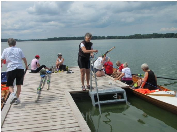
Lyngby Dameroklub og Hellerup Dame Roklub på tur på Furesø.

Roskilde rykker fem pladser tilbage og er nu i den tredjebedste række som nummer to. For Lyngby Dameroklub går det en plads frem til bronzepladsen i 3. division. Inger skriver: Selvom vi ikke fik roet så meget i ”Danmark rundt”, så havde vores 60+ gruppen arrangeret netværksroningen sammen med HDR. Vi havde to skønne dage, blandt andet en dejlig tur til Furesøen med efterfølgende lækker tre retters middag og tilhørende vin i klubben.