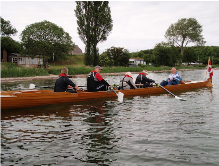
Roere fra Synnejysk Rotnetværk på madpakketur den 14. juni 2012 med Høruphav Ro- og Kajakklub som udgangspunkt.