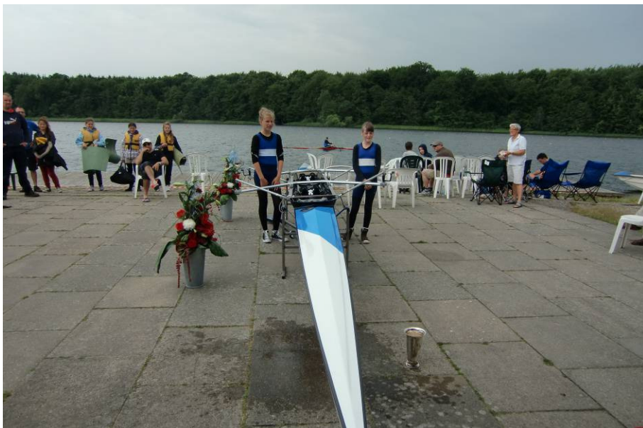
Festdag i Sorø Roklub. Der døbes en ny dobbeltsculler til ungdomsroerne.