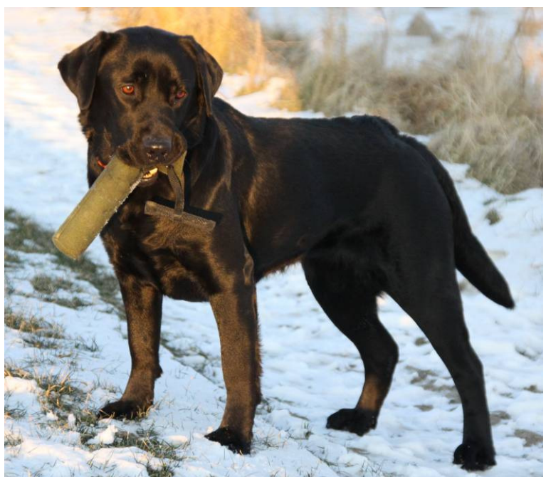
Vi tager ikke munden for fuld, når vi kalder Motionsturneringen for verdens bedste romotionsturnering. Fotomodel Soya.

Redaktionel bemærkning: I sidste års markedsføring af Vækstprisen benyttede Signaturen sig af gravide kvinder, uden at det affødte(!) den helt store interesse. I år bruges i stedet dyr i markedsføringen af Motionsturneringen. De sagesløse dyr, der illustrerer denne artikel, tilhører min søn og svigerdatter - og så må vi se om denne form for markedsføring giver mere pote – undskyld udtrykket. Jeg håber ikke, at jeg får Dyrenes Beskyttelse på nakken for at udnytte de stakkels dyr, men til almen