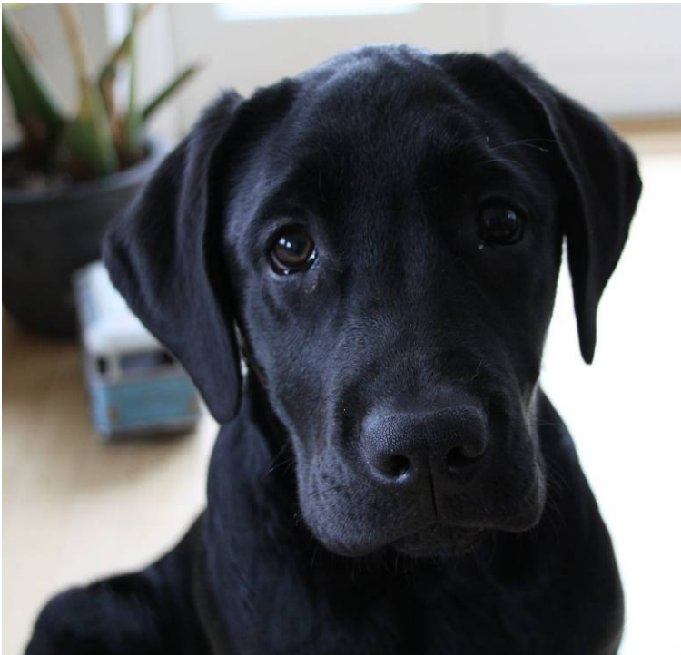
En hund efter rostatistik, -billeder og –nyheder. Fotomodel Mango.