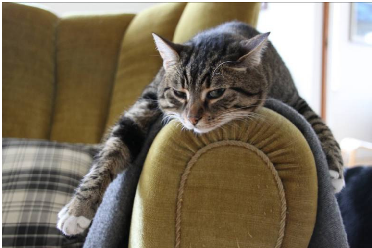
Man kan godt "misse" en runde eller to i Motionsturneringen, men sjovest er det at være med alle gange. Fotomodel Luksusmissen.

Men tilbage til roningen. Motionsturneringen 2013 er "Same procedure as last year – same procedure as every year, James" med andre ord: Kommunikationsstrategien er den samme som de sidste fire år. I ror af karsken bælg og indsender hver senest den tiende i måneden antal roede personkilometer siden standerhejsningen, antal roere der har deltaget i løjerne og gennemsnittet. Herudover et par ord om jeres roning, arrangementer mv. og måske et billede eller to. Man behøver ikke at sende lange indlæg, der er ikke plads til detaljeret at gengive alle de mange gode oplevelser som roning byder på - et par stikord er fint nok - og jo Signaturen er godt klar over, at jeg med en sådan udtalelse har anbragt egen røv i klaskehøjde! Er der nogen, der har svært ved at begrænse sig – så er det Signaturen, men I skal